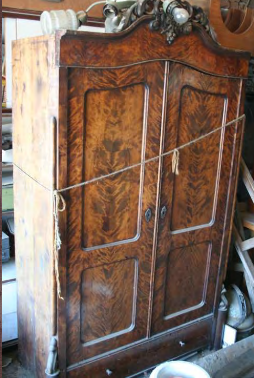
Sifonier Biedermeier sfarsit de secol XIX