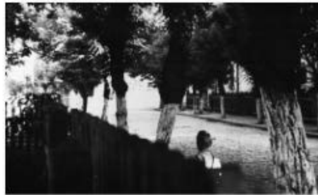
Parcelarea Văilor, strada GI. Popescu în anul construcției.

Casele au fost finalizate și repartizate, ceva mai tîrziu, unor salariați din bancă. (Alte case în aceeași situație, au fost preluate de Societate, care la-a dat tot unor salariați. Operațiunea a avut loc prin 1947-48. Criteriile de repartizare au fost cele ale