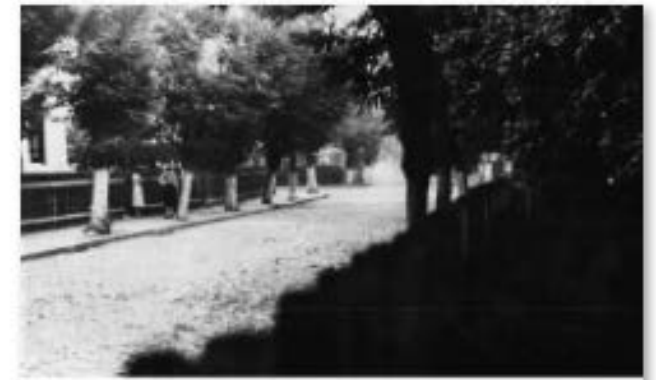
Parcelarea Văilor, strada GI. Popescu în anul construcției.